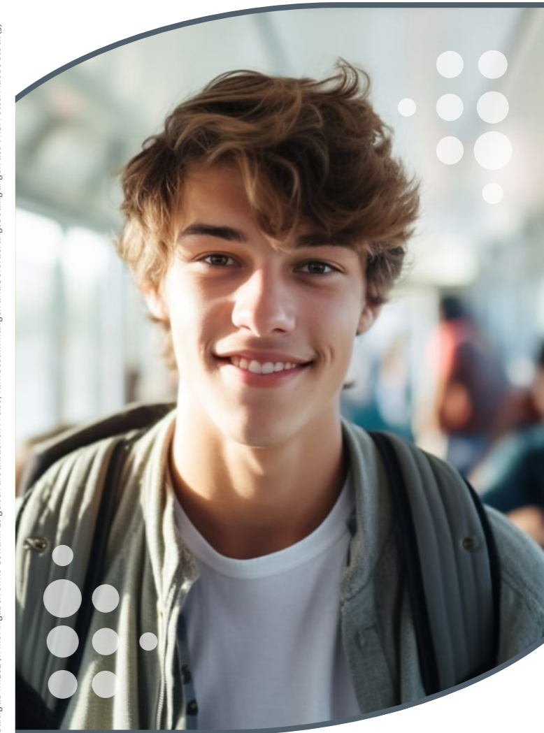
Gültig ab 1.1.2024. Alle Angaben ohne Gewähr. Es gelten die aktuellen Preise, Tarifbestimmungen und Beförderungsbedingungen des VRB.

www.vrb-online.de info@vrb-online.de Hotline: 0531 2426299